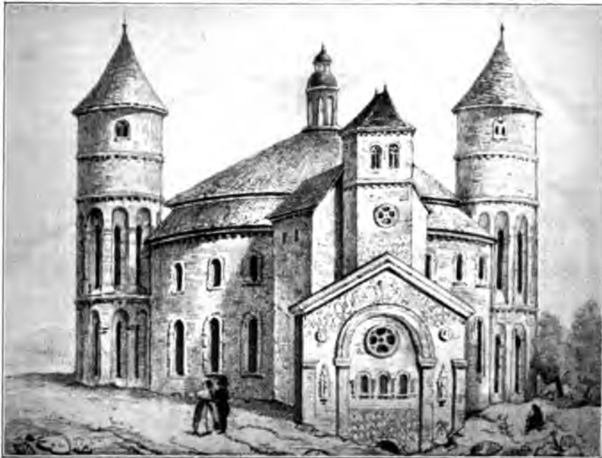
Le chevet de Saint-Bénigne. d'après une ancienne estampe.

C'est une construction souterraine, faite d'un oratoire central de forme ronde pourvu de deux bas-côtés et flanqué à l'ouest par la vieille chapelle de Saint-Jean-Baptiste, à l'est par un transept contemporain avec des chapelles en cul-de-four et des voûtes portées par de courtes colonnettes à chapiteaux. L'appareil est d'une puissance extraordinaire. Les voûtes étroites des deux collatéraux reposent sur de gros piliers isolés ou